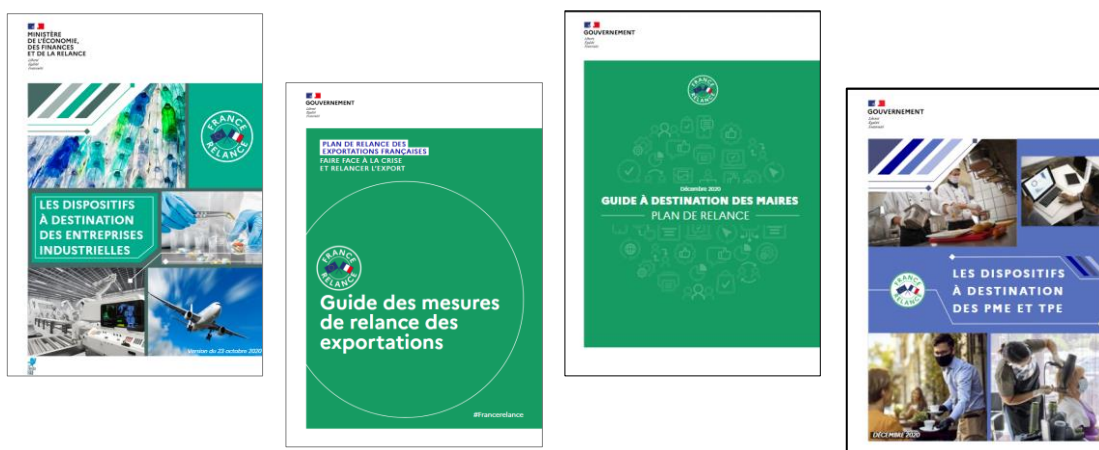
Couverture des 4 guides spécifiques ( www.planderelance.gouv.fr )