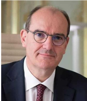
Jean Castex, Premier ministre

La France est en train de connaître un rebond historique. Un an après le lancement d'un plan de relance inédit par son montant autant que par sa dimension européenne, les résultats dépassent les estimations les plus optimistes. Non seulement les principaux risques liés à la crise ont été contenus mais, en quelques mois, notre pays a retrouvé son dynamisme. Quelques faits suffisent à en prendre la mesure : le taux de chômage revenu à son niveau d'avant crise, notre pays demeure le plus attractif d'Europe pour les investissements internationaux, tout particulièrement en matière industrielle, et l'objectif de 6% de croissance pour cette année est à portée de main.